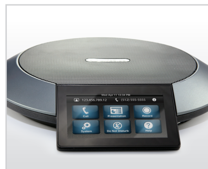
Inclut LifeSize® Phone™

Taux d'humidité ambiante de stockage: de 10 % à 90 %, sans condensation