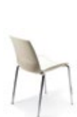
Chaises, page 116.

Différentes hauteurs, dimensions variées, formes, couleurs et finitions.