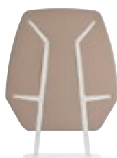
Cloisons, page 20.