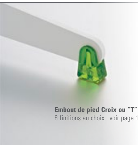
Embout de pied Croix ou "T" 8 finitions au choix, voir page 101.