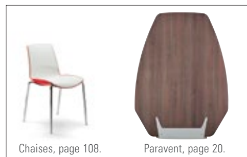
Chaises, page 108.