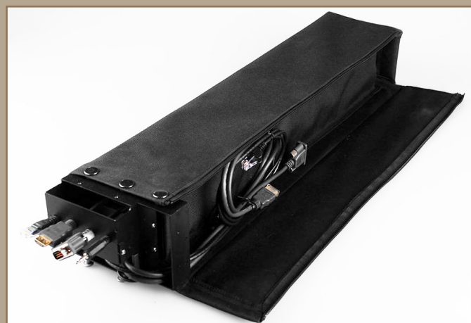
Colonne d'extension pour les câbles rétractables

Les boîtiers Cord Lite, avec leur finition métallique, sont disponibles dans 4 coloris différents, ce qui permet d'adapter facilement ceux-ci aux différents environnements de travail.