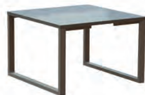
Table basse coordonnée (cf. p. 153)