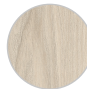
Orme du Cap blanc