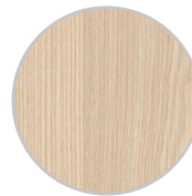
Frêne de Lyon Sable