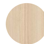
Frêne de Lyon Sablé