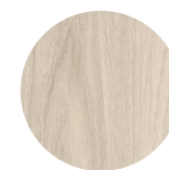
Orme du Cap Blanc

* Plus de coloris disponibles sur demande