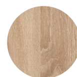
Chêne Bardolino Naturel