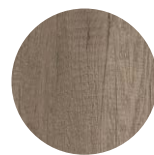
Chêne Nebraska Gris