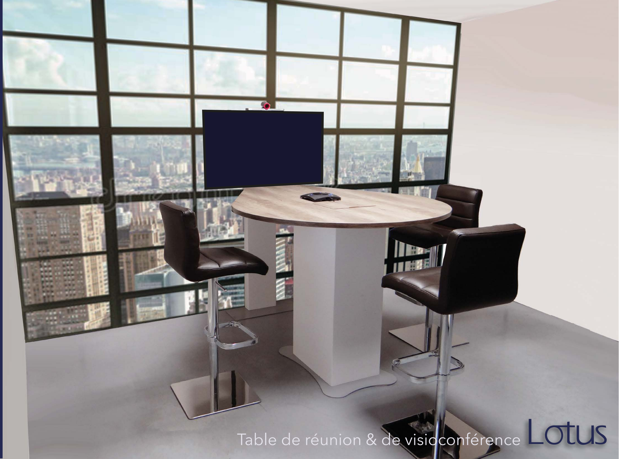
Table de réunion & de visioconférence Lotus