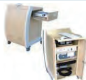
Mobilier de classe mobile