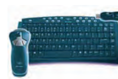
Pilotage sans fil