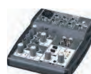
Tables de mixage