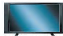
Ecrans LCD / plasma / tactile